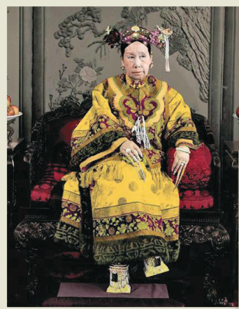
▶慈禧太后會找宮廷畫師為選好的照片上色 網絡圖片

調整「機位」，特別「折騰」。過去沒有現在的修版技術，慈禧選好的照片，會拿去找宮廷畫師為其面、服飾、擺設等一一上色，非常精美。這些着色照片，慈禧拿去送給外國的使節，叮囑他們擺在室內。相傳，慈禧相信照片能像真人一樣，對他們能起到控制作用。（新華網）