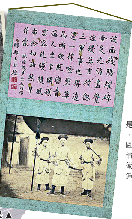
▲清宮最早的照片是23歲的醇郡王與侍衛的一張合影

故宮博物院上周公布了最新的藏品數量——1862690件。過去三年多的時間，故宮再次點清了15類宮藏文物，較之2010年完成第五次藏品清理後，多出了55132件。而這其中，故宮藏清宮老照片，無疑是「戲碼」最足的。18134張故宮老照片，訴說着數不清的陳年故事、說不盡的前朝舊夢。