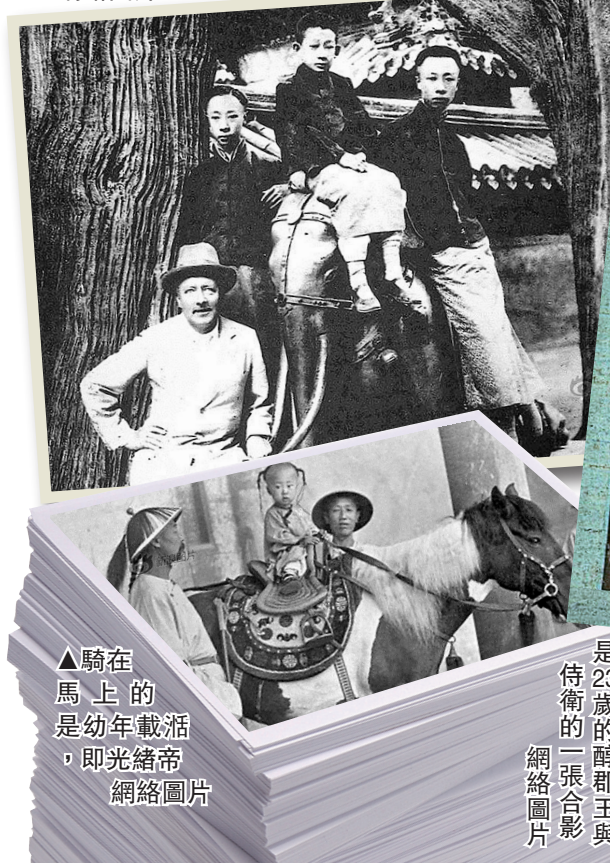
▲騎在馬上的幼年載灃，即光緒帝 網絡圖片