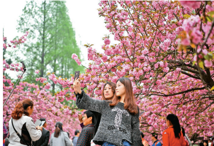
▲在安徽省合肥市，民眾在賞櫻自拍

進入四月以來，江西鄱陽湖、貴州畢節、邯鄲魏縣、安徽合肥等地的，紅花草、杜鵑、桃花、櫻花、雪海棠等鮮花競相綻放，吸引人們踏青出遊，感受春天氣息。