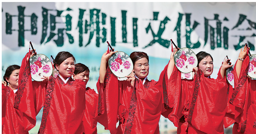
▲舞蹈員在表演當地特色民族舞 網絡圖片

在江西鄱陽湖，微風緩緩拂過，遊客在長滿紅花草的田野裏，盡情玩耍，盡情拍照，盡享花的芬芳，享受春日裏的美好時光。而在安徽合肥市的中國科學技術大學校園，園內的櫻花亦已全面盛開，吸引民眾遊玩賞景。（央視網、中新社）