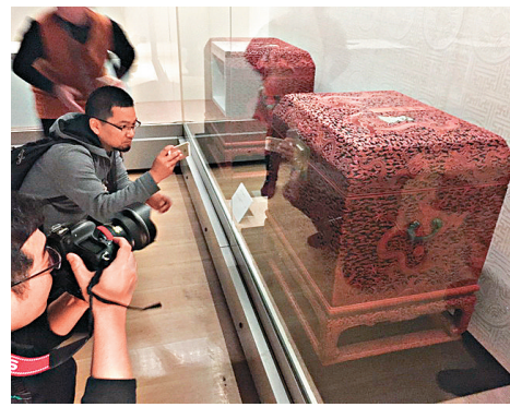
▲故宮博物院公布最新的藏品數量達一百八十多萬件

記者了解到，紫禁城內的清代皇帝和后妃們，開始接受現代攝影技術始於20世紀初。而這張154年前拍攝的親王舊影，比