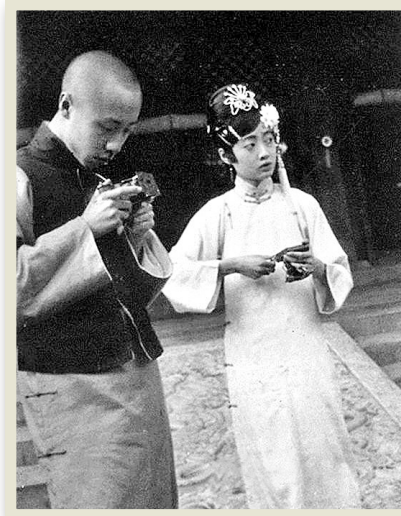
▲大婚後的溥儀和婉容在宮內照相