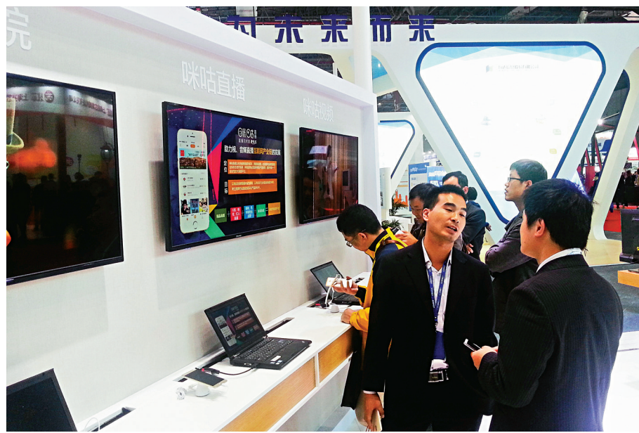
▲分析認為，服務業整體走勢仍處擴張區間，且未來仍能延續穩健運行態勢