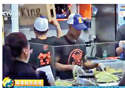
▲「老金煎餅」將中國煎餅根據美國人的口味進行改良 視頻截圖