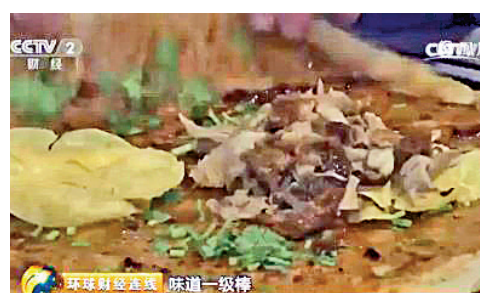
▲煎餅餡料用上烤豬肉、烤鴨以及紹興酒泡的撕碎雞肉 視頻截圖