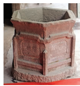
▲六角石缸遺存

原來均有石雕紋飾，惜已風化不辨。石缸亦為長方形砂岩石整體製成。此外，窰池、六角缸和石缸所雕紋飾多以剔地平雕技術為主，圖案多為空心或實心菱形構圖和卷枝花卉，顯得原始古樸，「既沿襲了黔北地區宋代發達的石雕裝飾藝術，又開啓了元、明時期較為簡略的裝飾藝術風格，顯現出一種由繁向簡轉折的過渡風貌」。（記者 周亞明）