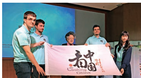
▲2017年度「看中國·外國青年影像計劃」北京啓動

2017年度「看中國·外國青年影像計劃」啓動儀式10日在北京師範大學舉行。今年「看中國」年度主題為「工匠·傳承·創新」，邀請了來自33個國家的103位外國青年參與項目。他們將分別前往12個省市深入體驗觀察中國工匠精神，每人拍攝一部10分鐘的紀錄短片。該103名外國青年將在中方志願者一對一協助下，落地北京、上海、廣東、雲南、廣西、湖南、甘肅、福建、河南、吉林