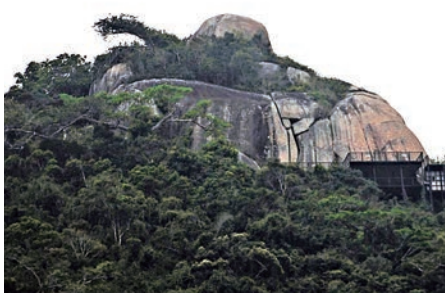
▲獲頒「世界最大天然彌勒石佛」的世界紀錄認證證書的「亞龍灣彌勒大佛」 網絡圖片

坐姿。在山腰眺望，巨石高大，光頭大肚，雙手合十，懷抱的大樹猶如龍頭拐杖，威嚴又慈祥，端坐山頂，自成一景，形象酷似大眾喜歡的彌勒坐佛。記者10日在景區看到，目前遊客到達山頂以後，可以步行直達大佛的腰部、頸部和右肩，站在巨佛的右肩觀海平台，飽覽三亞亞龍灣的山海美景。（中新社）