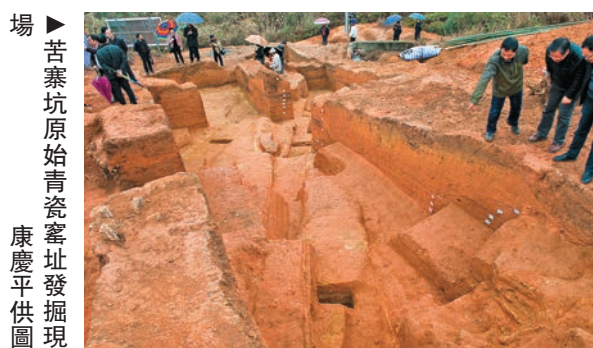
場▶苦寨坑原始青瓷窰址發掘現場

據悉，全國十大考古新發現評選，是中國國家文物局委託中國文物報社和中國考古學會每年度舉行的評選當年重大考古發現的一項活動，號稱考古界「奧斯卡獎」。（記者 蔣煌基）