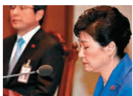
▲韓國前總統朴槿惠

需視調查情況再作定奪。此外，檢方屆時還將對SK、樂天等部分大企業的行賄嫌疑作出定論。