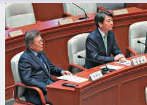
▲韓國大選候選人文在寅（左）與安哲秀12日出席國會會議

呼聲同樣很高的候選人安哲秀，其所屬的國民之黨反對部署「薩德」，但安哲秀日前也改變口風，稱在國家安全事務中，朝鮮核問題是重中之重。執政的自由韓國黨候選人洪準杓則強烈批評「文安」對「薩德」入韓突然改變立場，其行爲令人懷疑他們是否具備領導人素質。