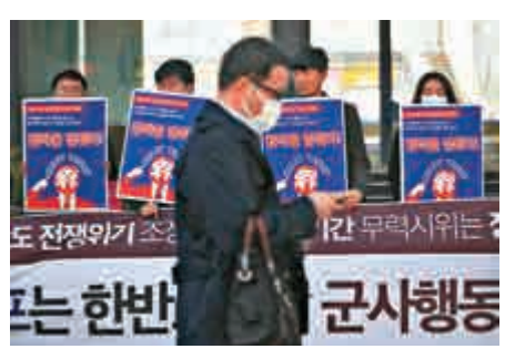
▲韓國民眾12日抗議美國對朝鮮採取軍事行動

遭到災難性的破壞。針對相關傳言，韓國外交部發言人稱，美國明確表示過，不會不同韓國商量就採取新的政策或措施，韓國民眾不應被網上毫無根據的傳言「蒙蔽」。