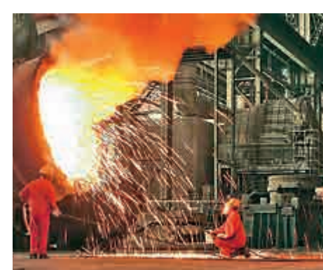
▲去年中國鋼鐵去產能任務，河北省佔三分之一

。另據中通社報導：雄安新區臨時黨委、籌委會日前印發文件提出，要盡量做到邊生產、邊搬遷，最大限度保障企業利益，並劃定雄安新區起步區，強調要徹底「管死」。