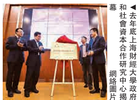
▲去年底上海財經大學政府社會資本合作研究中心揭幕

創新工作，實施高質量PPP項目盡快形成示範效應；二是抓PPP項目證券化；三是針對基層部門PPP實施能力普遍不足問題加強政策和實務操作培訓。