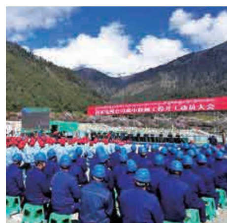
▲世界海拔最高輸變電工程藏中聯網工程6日在林芝開工，西藏電網將邁入超高压時代

中金公司首席經濟學家梁紅對首季GDP預期更為樂觀，料一季度中國實際GDP同比增速或小幅加速至6.9%。摩根大通中國首席經濟學家朱海斌相信，今年中國民間投資增速或回升至6%至10%，對整體經濟企穩將產生重要推動作用。