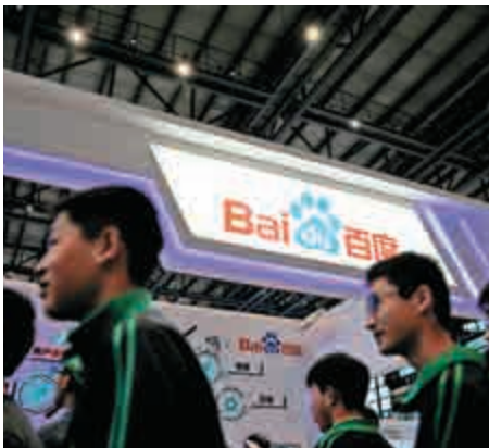
▲百度為加強在AI領域的領先地位，已部署一系列投資 資料圖片

），專注於投資AI、AR、VR等科技創新專案，第一期基金規模達2億美元，並於今年2月參與了新西蘭人工智慧初創公司8i的2700萬美元B輪融資。