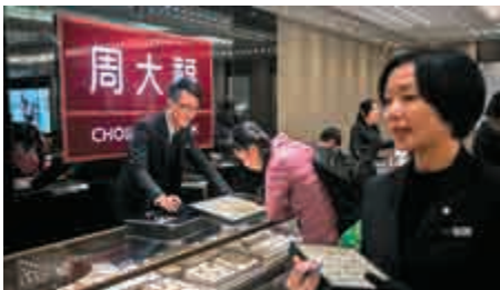
▲周大福上季香港及澳門同店銷售轉好，股價昨升5.8%，逆市破頂 資料圖片