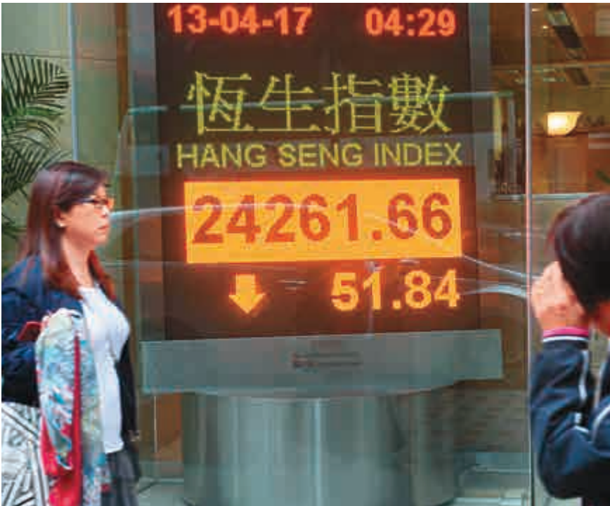
▲資金炒股不炒市，恒指昨日最多曾跌155點，收市跌51點，報24261點

分析表示，23800點至23700點有大量恒指牛證，理論上，淡友有誘因把指數質低至該水平屠牛，可是近日屢攻不破，無功而回，反映市場購買力十分強。因此，在月底前，指數應該維持長方形通道上落。