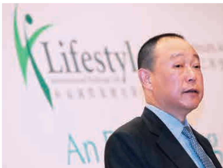
利福地產的出售，有助利福國際精簡架構。資料圖片

利福地產於去年年報中亦指出，由於瀋陽當地的零售商業物業市場競爭環境已發生變化，該公司將考慮當時市場狀況，並重新考量成本及回報後，才決定是否會繼續投入大量發展成本於該項目。