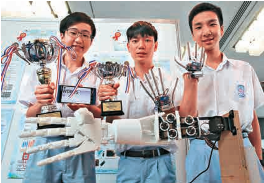
▲基督教宣道會宣基中學的作品「手語翻譯手套」勇奪高中組發明品冠軍

本港的科學家或工程師。他勉勵學生按照興趣發展潛力，不要擔心讀科學會找不到工作，若深港河套創科園七年內落成，能創造五萬個就業職位。