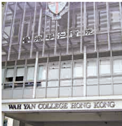
▲香港華仁書院本月底將會就轉為直資辦學展開諮詢