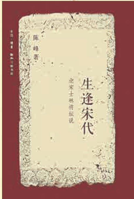
▶陳峰著《生逢宋代》（三聯書店出版社，二〇一六年）