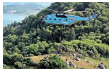
▲中國兩棲作戰步兵從直升機滑降

觀察者網軍事評論員表示，中國仍需大大發展兩棲投送能力，在一些關鍵的技術裝備獲得突破後，如船塢登陸艦主發動機和新型中型直升機，中國兩棲力量的建設速度在中短期內必將越來越快。