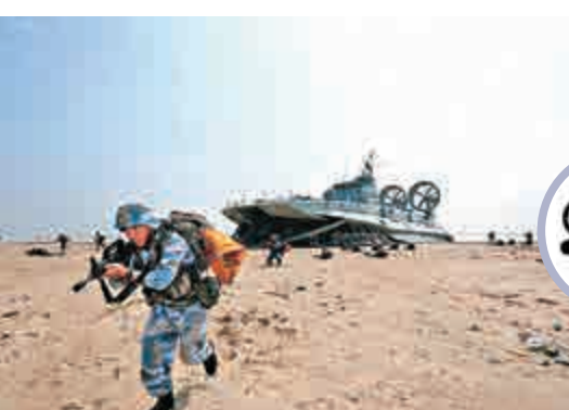
▲陸戰隊員利用氣墊船搶灘 網絡圖片

美國《國家利益》網站3月底刊文稱，中國第一艘擁有直通甲板的075型兩棲攻擊艦075型將在2020年完工，該艦與美國的「黃蜂」級兩棲攻擊艦的規模大致相當，排水量約40000噸的075型兩棲攻擊艦能給中國海軍提供顯著的力量投射能力。該軍艦長約250米，寬約30米，能搭載30架直升機，飛行甲板可同時起降6架直升機。它還將擁有一個塢艙，用於投放各種類型登陸載具和水陸兩棲戰車。