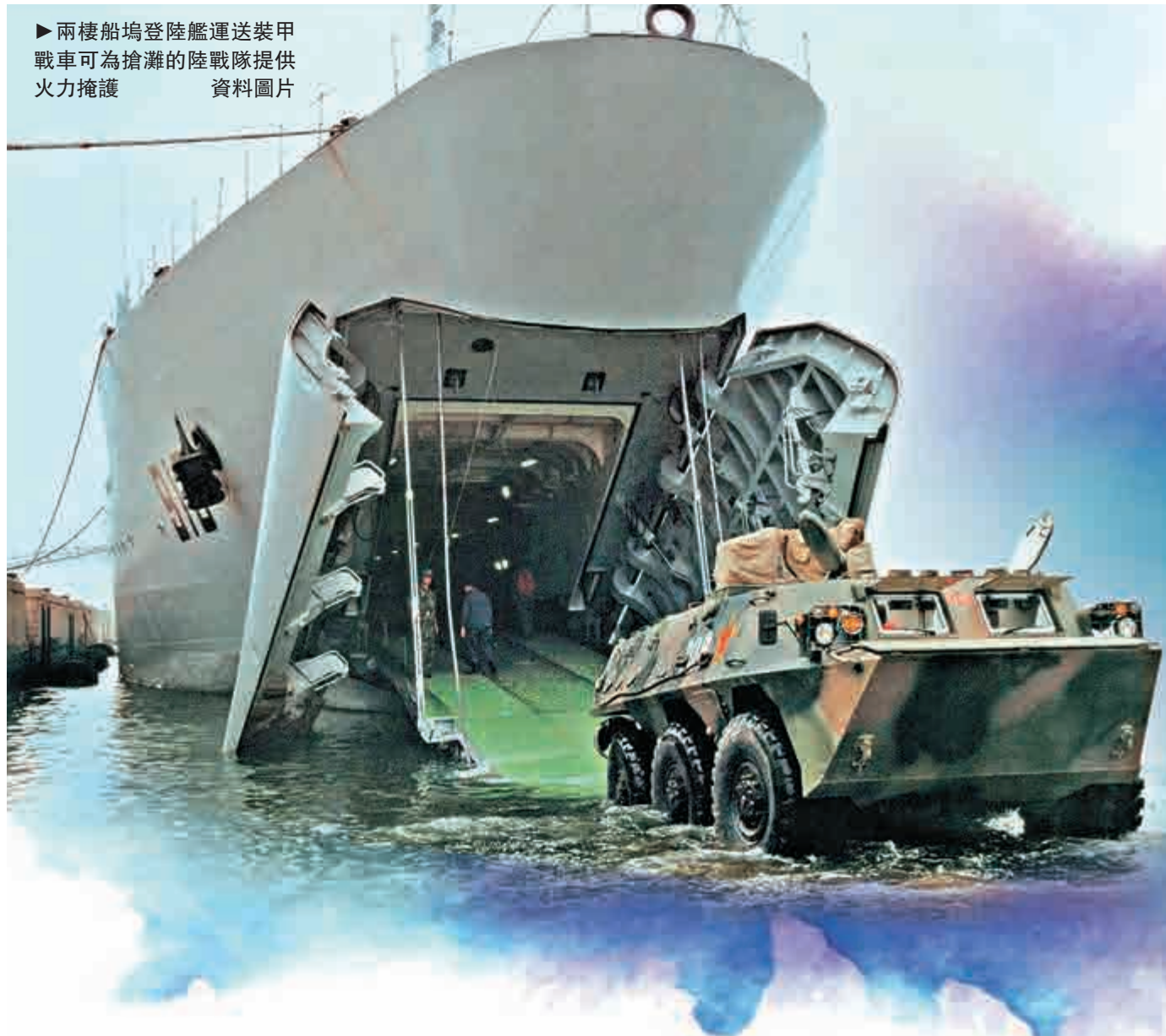
▶兩棲船塢登陸艦運送裝甲戰車為搶灘的陸戰隊提供火力掩護 資料圖片