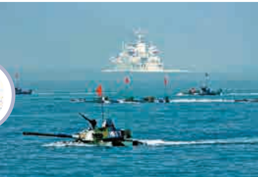
▲兩棲船塢登陸艦可投送各類兩棲戰車 資料圖片