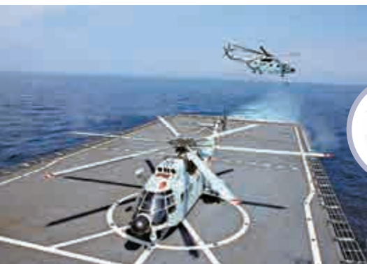
▲艦載直升機有助實現立體式登陸作戰 資料圖片