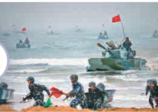
▲今年3月，海軍南海艦隊某登陸艦支隊在陌生海域開展多方向立體奪控島礁演練