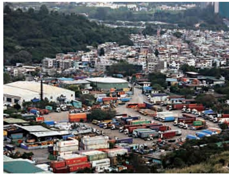
▲政府計劃興建「多層式物流大廈」安置棕地作業