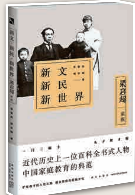
▲李喜所、胡志剛著《新文·新民·新世界：梁啟超家族》由新星出版社於今年二月出版

從師康有為的四年，梁啟超的思想發生了氣質性改變，他基本接受了康有為今經學的學術觀點、迴圈進化論的歷史觀和天下為公的大同理想，並因康有為的維新變法思想而熱血沸騰。一八九四年，是維新運動由思