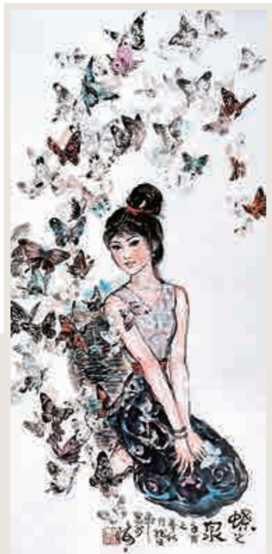
▲韓伍畫作