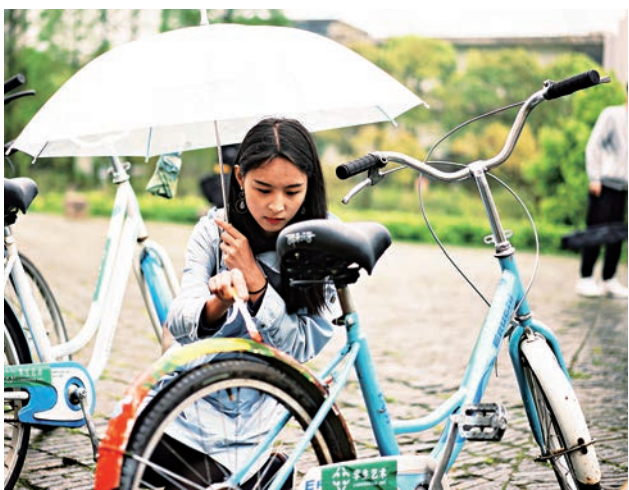
▲美院學生在廢舊單車上進行塗鴉創作