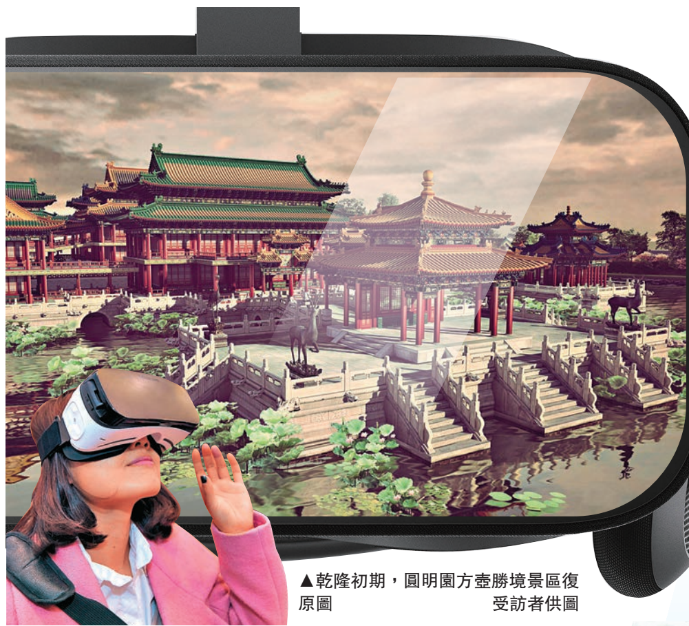
▲乾隆初期，圓明園方壺勝境景區復原圖