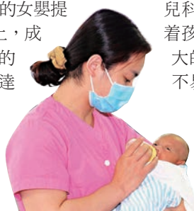
▲護理士抱著早早餵奶