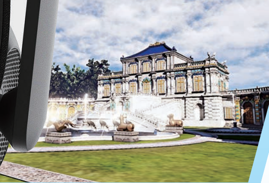
▲園內西洋樓景區復原圖