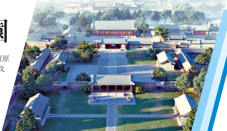
▲圓明園正殿正大光明鳥瞰復原圖

圓明園，這座堪稱「一切造園藝術典範」的文明奇跡，荒蕪、消失了百餘年。如今，在圓明園將迎來建園310周年之際，清華團隊經過15年研究的虛擬復原技術，通過80餘位專業人員、10000餘件歷史檔案、4000幅復原設計圖紙、2000座數字建築模型……目前已精準復原全園60%景區，讓這所承載着世界文明奇跡的「萬園之園」得以重生。而團隊研發的虛擬現實、增強現實等導覽系統，可讓民眾體驗360度園景重現，感受昔日輝煌。