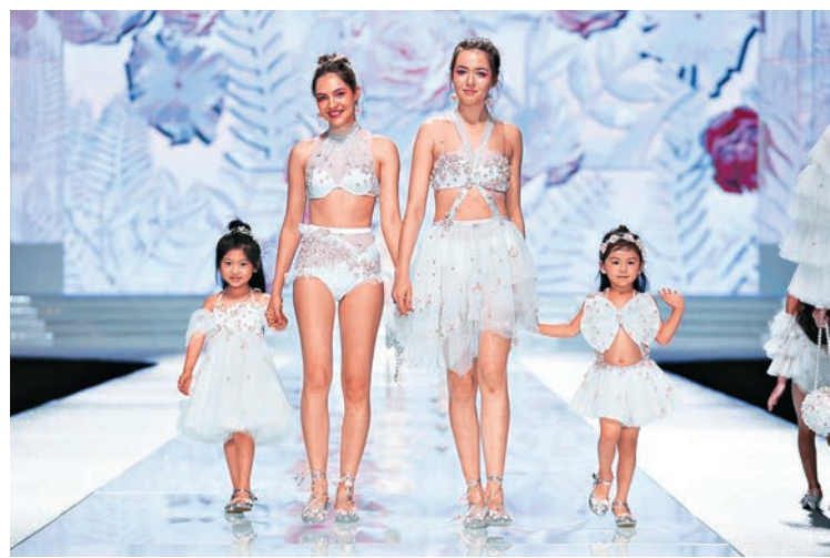
▲深圳內衣秀上的摩登親子裝