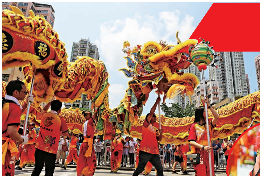
▲▲ 尋日元朗非常熱鬧，有好多市民圍觀舞龍舞獅。小朋友都有出力，舞起小獅子

到底有咩做呢？其實就係要設立、發展及管理天文台的社交媒體平台，包括facebook及Instagram，設計、製作、發布社交媒體內容，推廣天文台服務等。不過呢，呢個係非公務員合約，而截止申請日期就係五月二日。有興趣嘅朋友，記得提早申請喇！