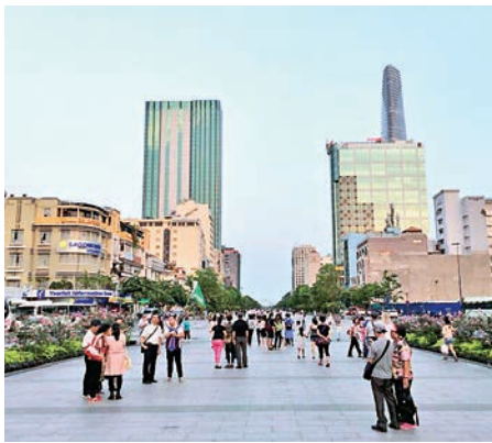
▲越南去年已超越馬來西亞，成為中國在東盟國家中第一大貿易夥伴

他分析越南的基本優勢，首先是近1億的人口，勞動力充沛；第二個是海岸線從南到北近3300多公里，海上物流上有成本