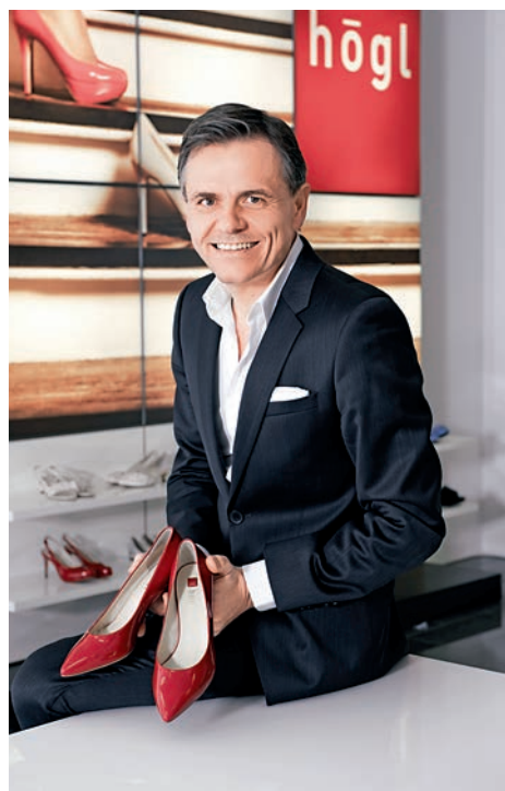
▲ Högl CEO手捧該品牌當季小紅鞋 網絡圖片