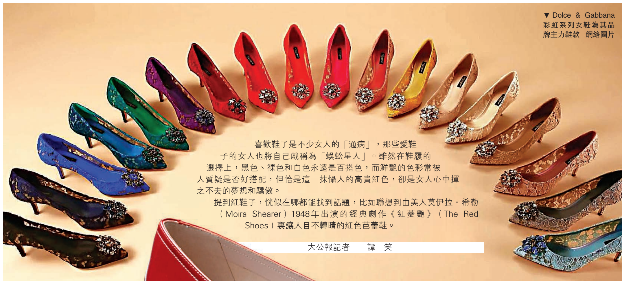
▼ Dolce & Gabbana 彩虹系列女鞋為其品牌主力鞋款

喜歡鞋子是不少女人的「通病」，那些愛鞋子的女人也將自己戲稱為「蜈蚣星人」。雖然在鞋履的選擇上，黑色、裸色和白色永遠是百搭色，而鮮艷的色彩常被質疑是否好搭配，但恰是這一抹懾人的高貴紅色，卻是女人心頭揮之不去的夢想和驕傲。