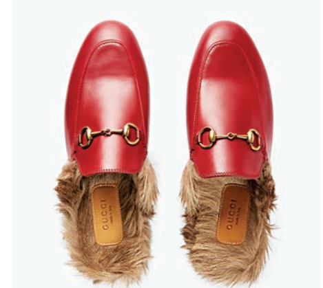
▲ Gucci紅色款「毛拖」

Manolo Blahnik、Jimmy Choo、Prada、Valentino、Louis Vuitton……幾乎所有耳熟能詳的大品牌，再到Steve Madden、Le Saunda、Nine West等時尚品牌，甚至是Adidas、Puma、Nike這樣的運動品牌，都有幾款可圈可點的紅鞋。無論是高跟鞋、平底鞋，還是運動鞋，腳上的一抹紅色，都會成為整身搭配的點睛之筆，一年四季都讓女人熱情四溢、積極向上。也許這就是小紅鞋的魔力吧。