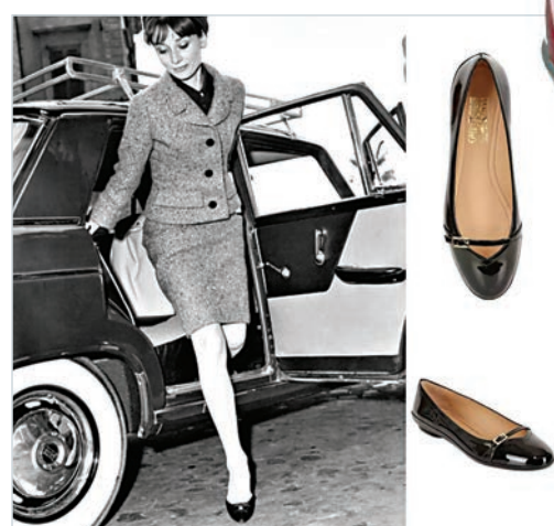
▲ Salvatore Ferragamo 的瑪麗珍鞋也是夏萍喜愛的鞋款之一