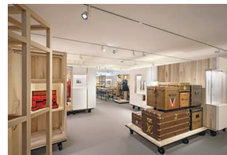
▲展覽開放時間：星期一至星期日上午10時至晚上8時