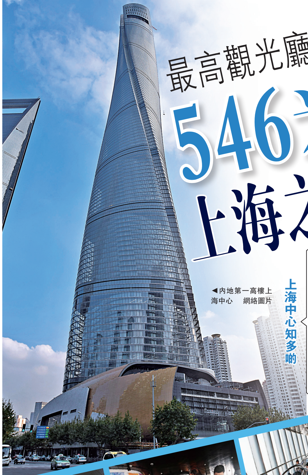
在上海之巔可俯瞰環球金融中心等