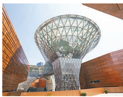
▲世博會博物館外觀

永錄博物館參照皇家園林建築風格，做工精細，中國古建築與館內藏品渾然天成，無不體現着工匠高超的技藝與民族文化的精髓。據悉，館內展品種類豐富、工藝精湛，分別藏有河湟民俗藏品4000多件，明清紅木傢具1000多件，鳥木及金絲楠木雕刻藝術品150多件，景泰藍等藝術珍品300多件。