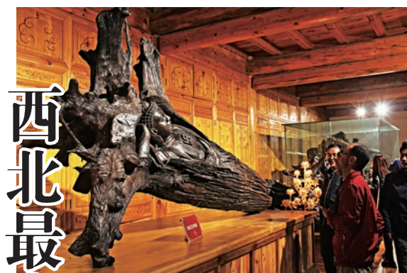
▲永錄博物館內的精品珍貴鳥木雕刻