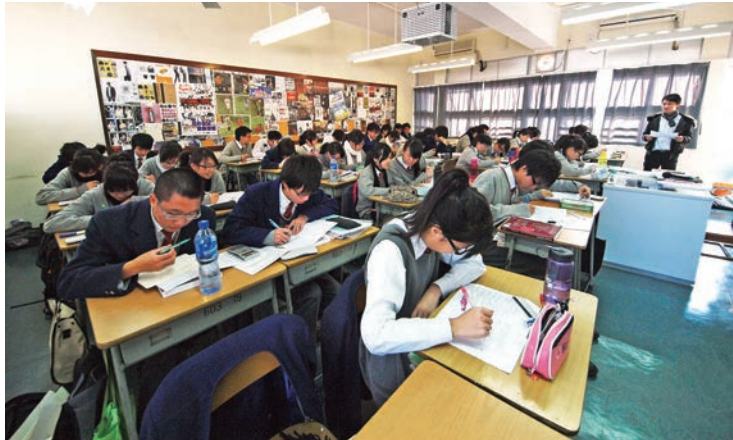
▲語文基金2007年批出2.25億元，支援160間中、小學推行「普教中」

教育局發言人表示，歡迎審計署就語文基金的運作提供建議，將審視有關建議及作出適當跟進，並繼續與語常會緊密合作，致力確保有效運用語文基金。