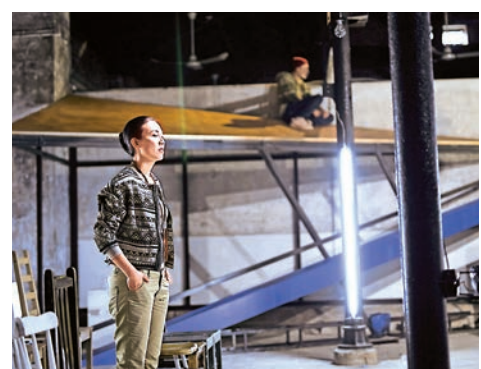
▲紀錄片導演尤利卡