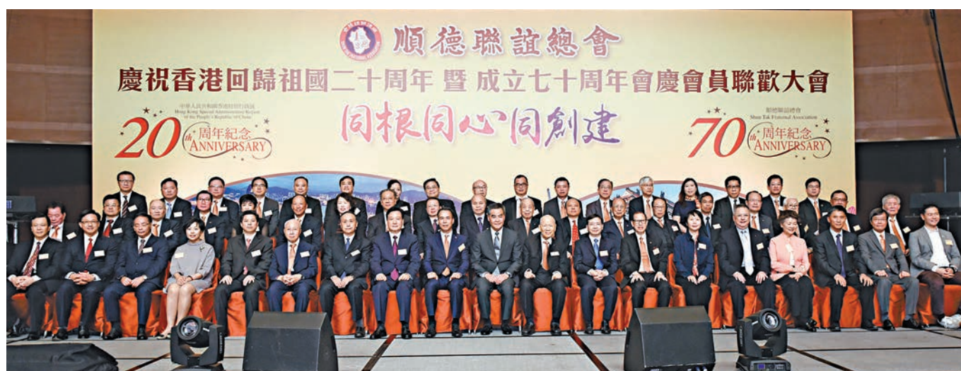
▲順德聯誼總會「慶祝香港回歸祖國20周年暨成立70周年會員聯歡大會」日前舉行。行政長官梁振英，中聯辦副主任林武，順德區區長彭聰恩等蒞臨主禮