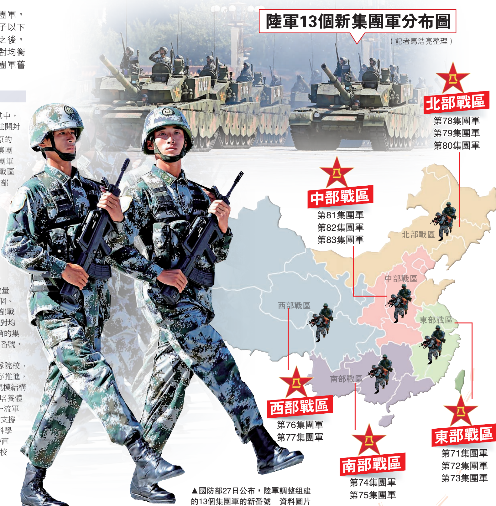
▲國防部27日公布，陸軍調整組建的13個集團軍的新番號 資料圖片