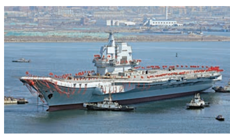
▲26日上午，中國第二艘航空母艦下水儀式在大連舉行

宇軍說，上個月國防部新聞局的同事已經在例行記者會上作了發布，目前沒有更多信息可以補充。