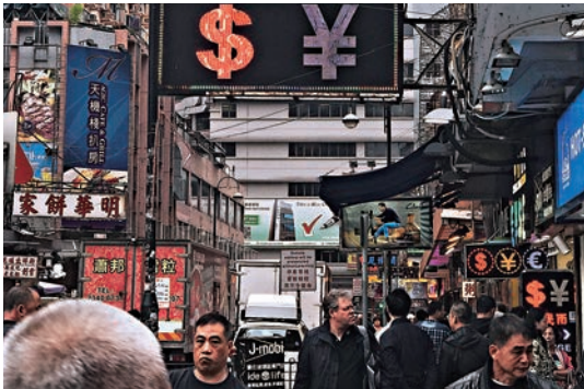
▲找換店業內人士透露，近期內地客匯款來港生意增約兩成

除了「匯款」，大額保險客戶會在本港開設銀行戶口，透過香港戶口向保險公司繳付保費。不過，香港銀行近期收緊了內地客