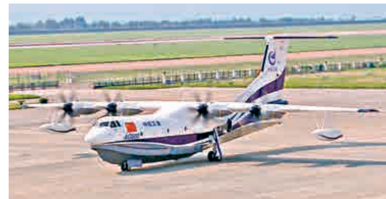
◀29日，國產大型水陸兩棲飛機AG600在珠海成功進行首次地面滑行試驗

有專家指出，AG600依託良好的氣水動融合布局和先進的海洋環境下耐腐蝕技術，最大巡航速度500公里／小時，最大航時12小時，最大航程4500公里，它可以從三亞飛抵中國整個南海海域執行各項任務。