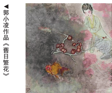
▲郭小凌作品《舊日繁花》