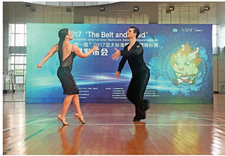
▲舞者現場表演國際標準舞