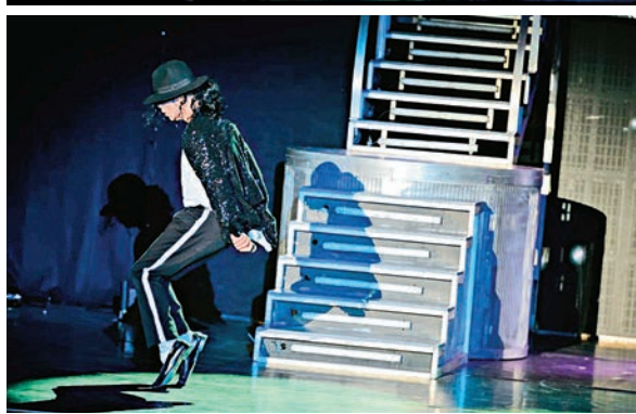
▲《THRILLER LIVE》向傳奇「流行天王」致敬 米高積遜四十五年的音樂生涯