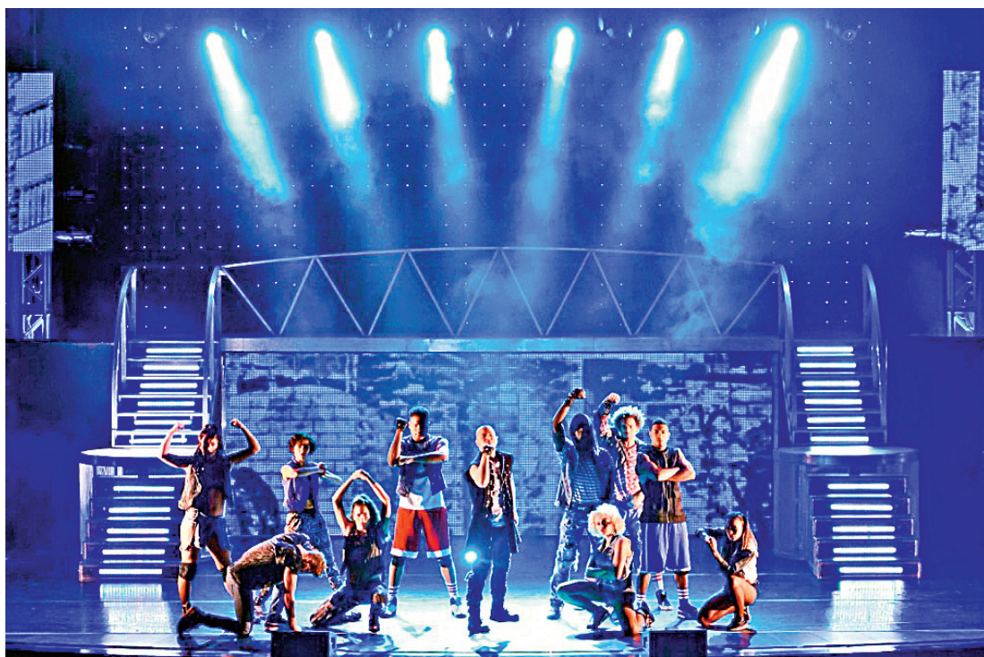
▲音樂劇《THRILLER LIVE》正於澳門巴黎人劇場演出

已連續公演八年的《THRILLER LIVE》始於英國倫敦城西，這場九十分鐘的音樂劇帶領觀眾遊走一場充