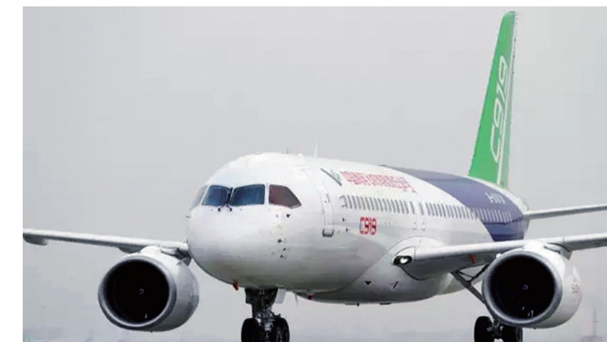
▲國產大飛機C919最快將於明日首飛

，其整個市場規模將有萬億元之巨。 C919大型客機是我國首款按照最新國際適航標準研製的幹線民用飛機，客艙布局包括基本型混合級布局158座、全經濟艙布局168座、高密度布局174座三種，標準航程達4075公里，增大航程5555公里，可滿足對不同航線的需求。