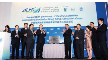
▲2014年11月19日，中國海事仲裁委員會香港仲裁中心在港成立

來，在中國和東盟國家的共同努力下，南海局勢不斷趨向向好。這一形勢來之不易，值得各方共同珍惜和維護。我們也希望有關外國尊重東盟地區國家共同維護南海和平穩定的努力。」耿爽說。