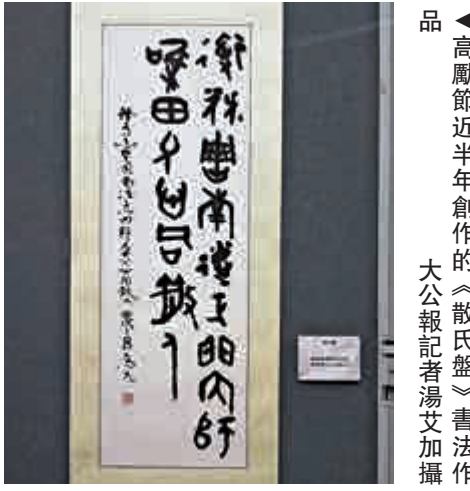
▲此次展覽展出多幅大尺幅立軸畫作及書法作品

節目每日放映兩場，逢周六、日及公眾假期加開下午十二時二十一分一場。詳情查詢可電二七二一〇二二六，或瀏覽網頁hk.space.museum。