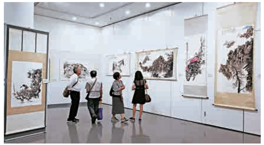
▲高勵節近半年創作的《散氏盤》書法作品