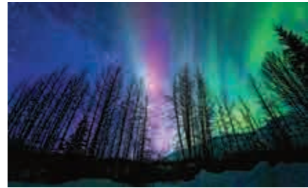
▲圖示的極光一般在距離地面九十公里以上的高空閃爍，最高可達地面以上四百公里