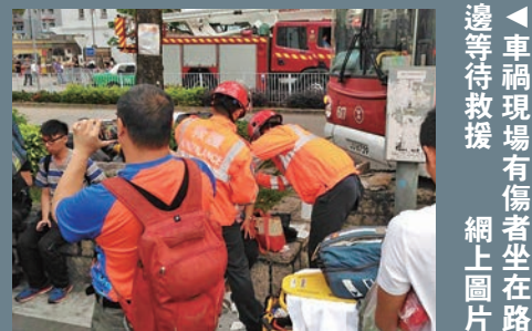
▲車禍現場有傷者坐在路邊等待救援 網上圖片