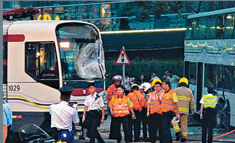
▲涉事輕鐵車頭損毀及凹陷 網上圖片