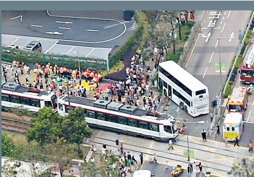
▲港鐵巴士與一列輕鐵在天秀路相撞，警方初步不排除有人衝燈肇禍

港鐵發言人指，涉事巴士當時在服務中，事發後輕鐵部分線路改道，港鐵安排免費接駁巴士接載受影響乘客，至晚上接近八時，現場清理完成，涉事輕鐵及巴士被拖走後，現場交通陸續回復正常。