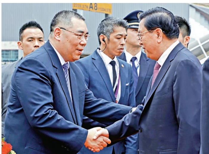
張德江抵達澳門後，與澳門行政長官崔世安親切握手

第三是「鼓勁」，張德江認為，澳門回歸以來取得輝煌和令世人矚目的成就，來之不易，應充分肯定，但澳門目前也面臨着轉型發展的重要階段，「在這個時候，社會各界如何能夠跟特區政府同心同德