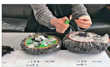
▲有了光譜成像設備，不用燒也能分辨真假紫菜

把一片顏色形狀都極其逼真的假葉子，放在一大叢樹葉之中，僅靠肉眼很難識別，然而在光譜測量的「火眼金睛」下，瞬間現形。這項常見於軍事中的反偽裝技術，被中國航天科工集團公司下屬的天津津航技術物理研究所光譜測量工程團隊找到了新的用武之地，讓這「黑科技」也可照進你的碗裏，令假冒食品無所遁形。