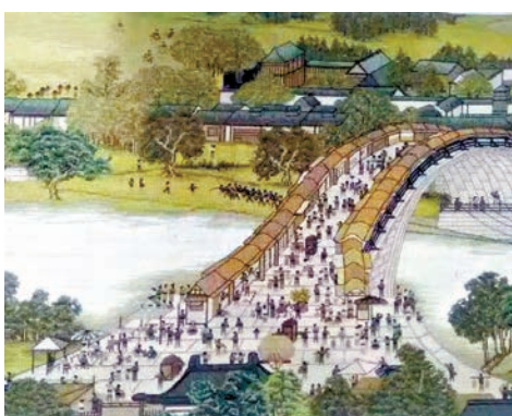
▲李進民創製的巨幅十字繡《清明上河圖》局部