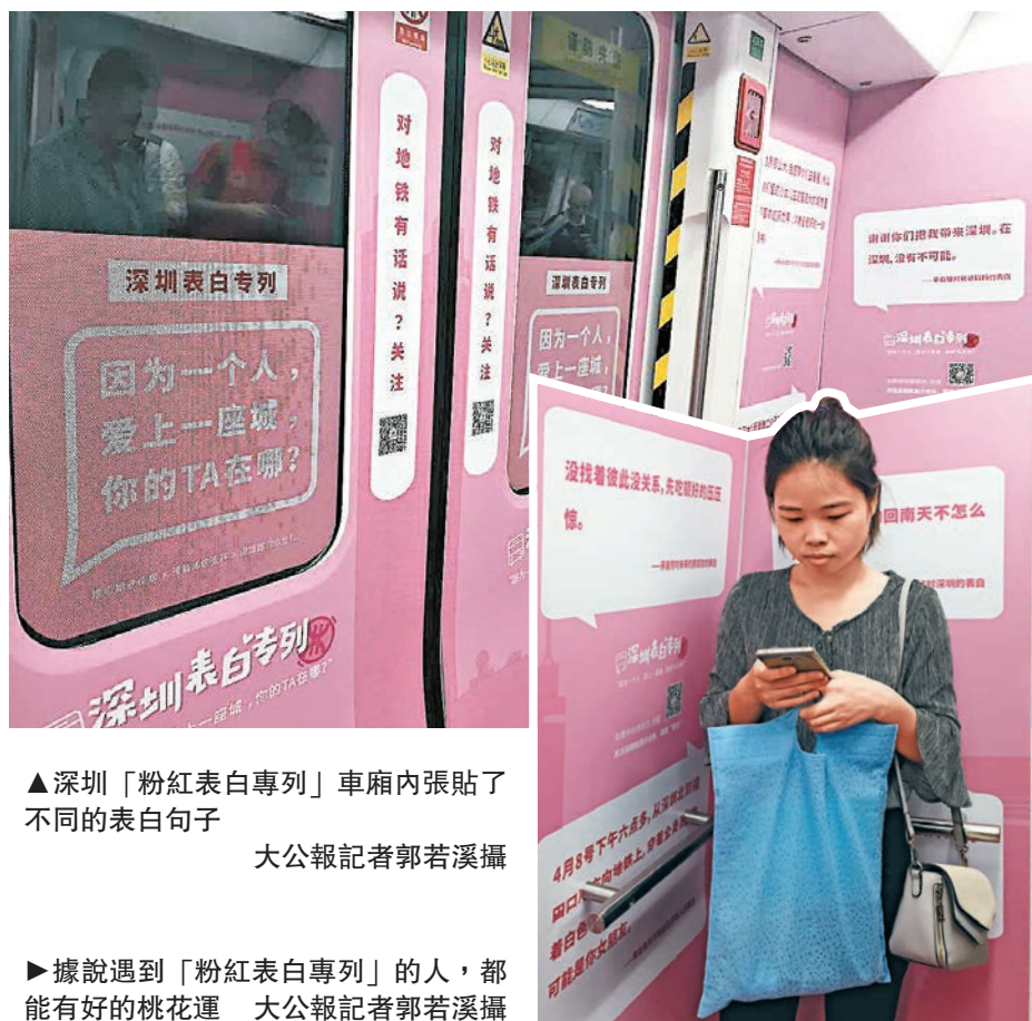
▲深圳「粉紅表白專列」車廂內張貼了不同的表白句子

近日，安徽省合肥市姚公社區開展感恩母親活動。小朋友畫出心中最美媽媽，並將繪畫作品送給媽媽