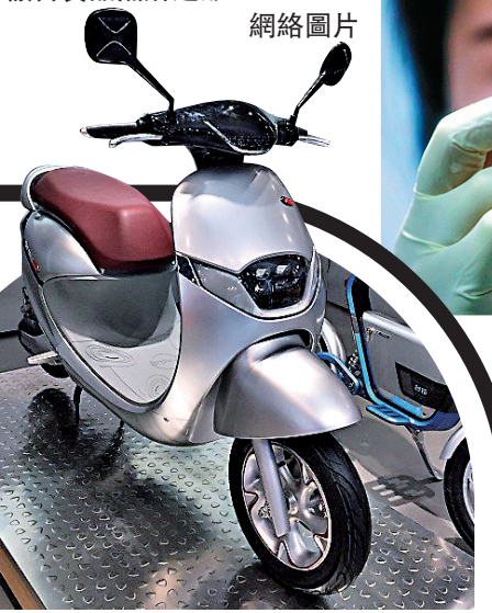
▲獲德國紅點獎的國產電單車