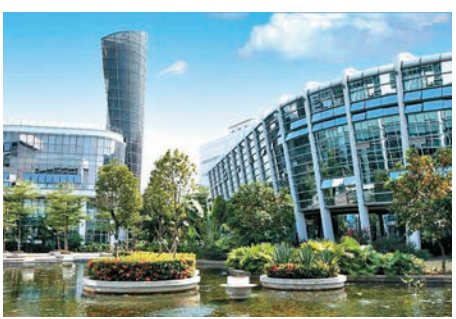
▲官洲國際生物論壇永久選址廣州國際生物島（原官洲島）。圖為生物島內景

示生物產業成就、科普互動體驗、生物藥、化學藥、中醫藥、醫療器械、精準醫療、幹細胞與再生醫學、生物農業、生物能源等行業高精尖領域以及我國主要生物產業基地，預計將吸引200多家參展企業、1萬餘海內外專業觀眾參展。