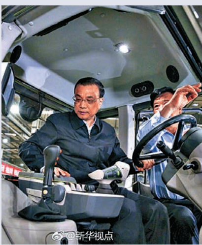
▲李克強登上大馬力拖拉機