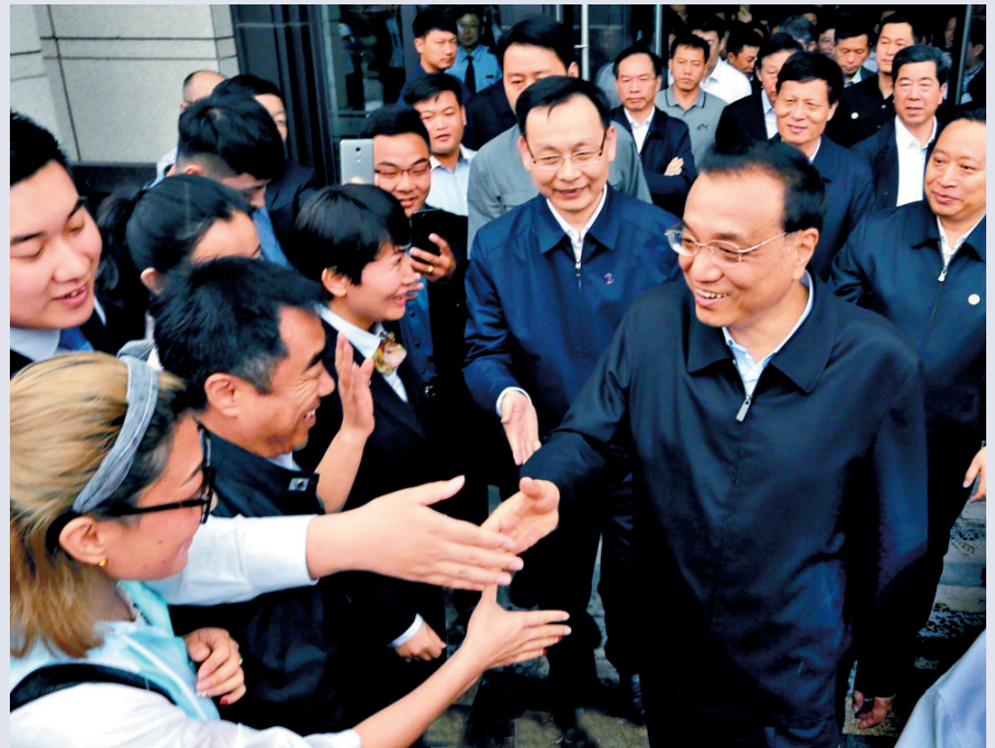
▶李克強在河南自貿區開封片區與當地工作人員握手