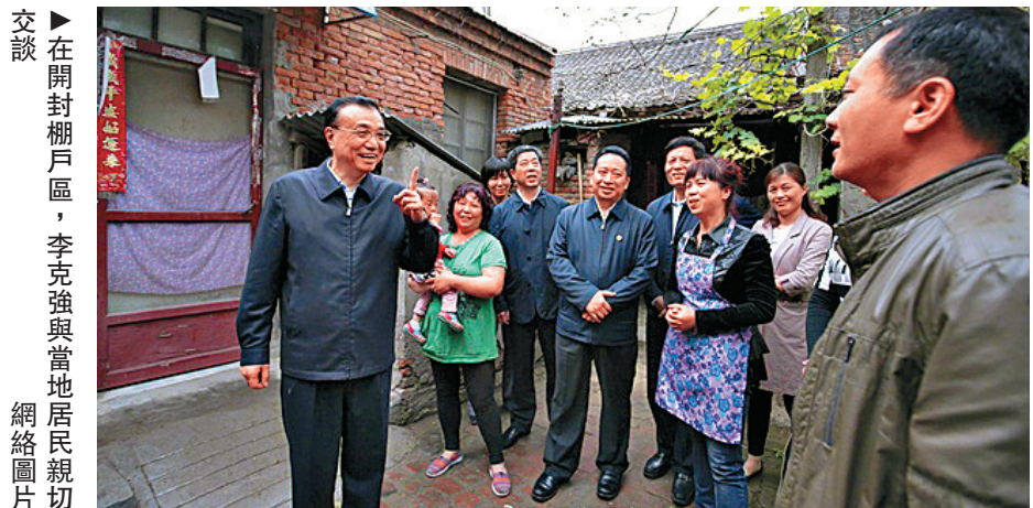
在開封棚戶區，李克強與當地居民親切交談 網絡圖片