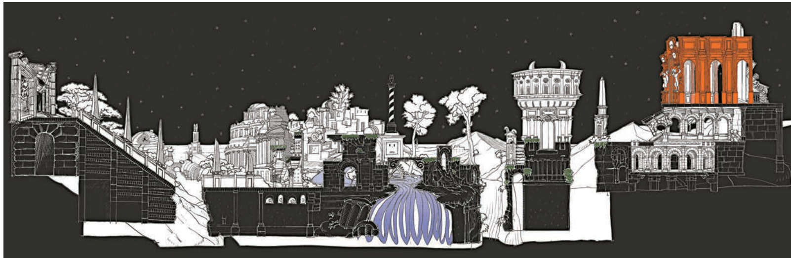
▲Nicolas Buffet作品《Super Polifilo》