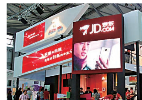
▲京東自2014年5月上市以來，單季首次實現盈利

截至今年3月底，京東過去12個月的經營現金流為102億元，相比去年同期經營現金流20億元，同比大幅增長超過4倍。