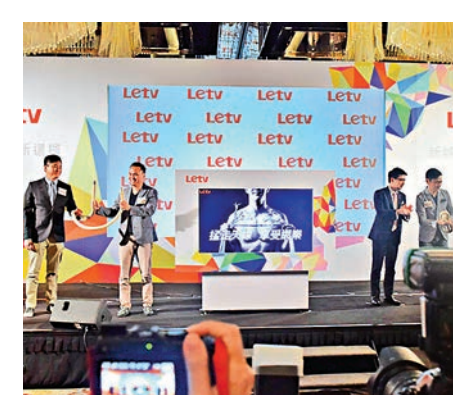
▲樂視的資金鏈問題一直備受關注

另外，香港寬頻（01310）與樂視體育LeSports HK宣布，即日起香港寬頻旗下家居寬頻、家居電話及個人流動通訊服務客戶，均可免費享用LeSports HK NBA組合兩個月，價值278港元。