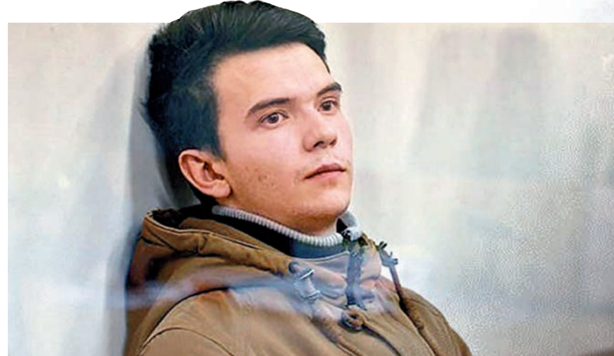
▲死亡遊戲「藍鯨」發明者布代金 網絡圖片

這款遊戲現已藉由網絡傳到多個國家，其中葡萄牙及西班牙兩地近日各有一名少女接受遊戲的「自殺挑戰」，其中一人跳橋跌斷腳，另一人亦受傷送院。英國、阿根廷、墨西哥等國都已發布警告，提醒家長多注意孩子的行為。目前在社群網站Instagram搜尋相關關鍵字也會出現警示。