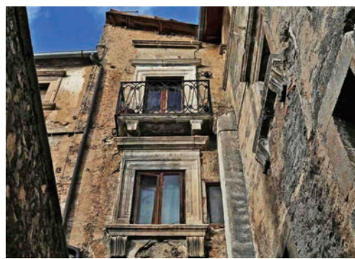
▲加利亞諾的一棟建築，租金為每月50歐元