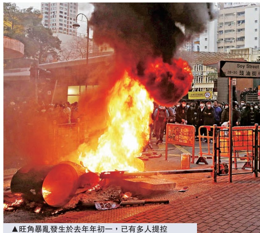
▲旺角暴亂發生於去年年初一，已有多人提控