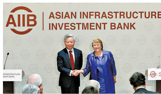
▲13日，亞投行行長金立群（左）與智利總統巴切萊特（右）共同出席新聞發布會