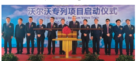
▲黑龍江—比利時專列啓動儀式現場

另據記者方俊明廣州報道：廣東國際鐵路經濟產業區14日透露，作為踐行國家「一帶一路」倡議的標志性項目，廣州中歐班列目前基本實現滿載運行，創下了內地中歐班列的新紀錄。據最新統計，自去年8月28日廣州首趟中歐班列後，8個月來共發出28列班列、1107個集裝箱、近萬噸貨物，實現了「一周一列」的常態化運作。