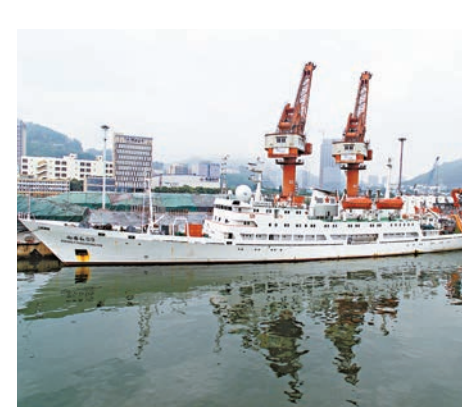
▲13日，搭載「蛟龍」號的「向陽紅09」船停靠在深圳赤灣港碼頭

補給後，計劃於5月16日奔馳雅浦海溝和馬里亞納海溝執行大洋38航次第三航段科考任務。