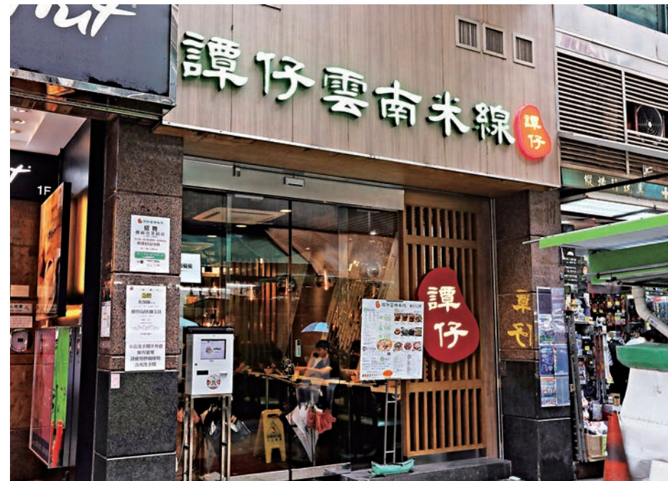
▲譚仔雲南米線純利率高達14%