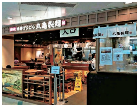
▲日本丸龜製麵積極拓展海外市場

此外，根據網站「openrice」統計，目前「譚仔雲南米線」共有46間分店。若不考慮公司自去年3月至至今的分店增減，按此計算，每間分店去年收入約1500萬元，每月分店收入約達125萬元。