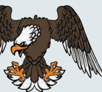
▲◀ 警員喺南灣隧道出入口附近被「空襲」傷頭皮

長青公路發生非常、非常罕見「閃襲」警員案。一名在巴基斯坦總理謝里夫到訪期間於南灣隧道出入口附近山頭站崗嘅警員，突然頭頂一痛，眼前一黑，抬頭一看，只見一個黑影，振翅揚長而去。警員摸摸頭皮，發現有血水滲出。呢個係警方為保護巴總理嘅「第一滴血」嘅。