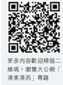
更多內容歡迎掃描二維碼，瀏覽大公網「港東港西」專題

嘅文章同新聞報道。而梁天琦出席嘅嗰場研討會，聲稱內容主要有三方面，包括探討香港嘅政治自由度，聯署支持香港示威及支援政治犯遊行等。「港獨」嘅香港已經係「過街老鼠」，梁天琦惟有勾結外國勢力播「獨」，同埋唱衰香港囉。