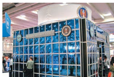
▲美國國家安全局內部

這次的勒索病毒爆發，只是美國國安局連串醜聞的最新一環。自2013年斯諾登事件爆發之後，美國國安局的監聽手法一直受外界所詬病，泄密者一個接一個，美國國安局應接不暇。前美國國安局局長海登承認，該局的惡意軟件一旦丟失，將對該局的未來「構成非常嚴重