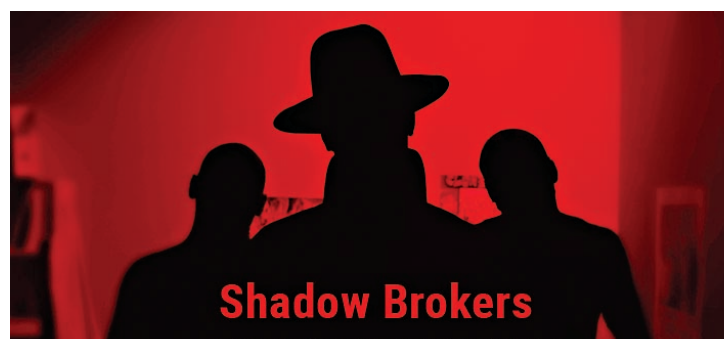
▲黑客組織「影子經紀人」網上圖片