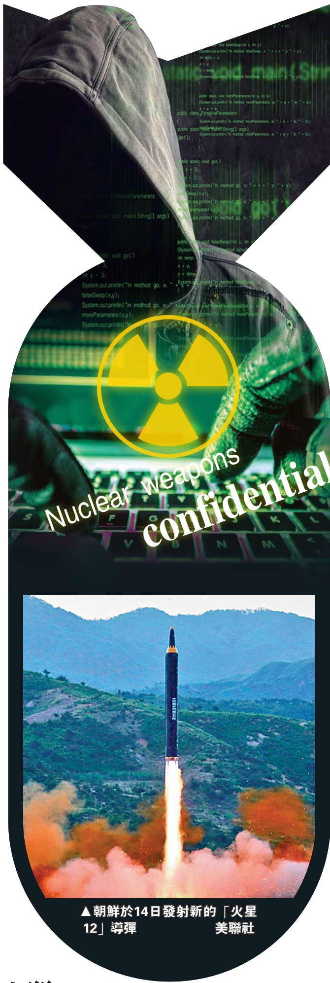
▲朝鮮於14日發射新的「火星12」導彈