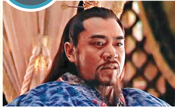
▲嘉靖帝不理朝政二十年，卻對朝局瞭如指掌

與內地劇《人民的名義》敘事結構一致，內地劇《大明王朝1566》亦採取以小見大的講述手法，從「改稻為桑」在建德、淳安落實情形開始，塑造貪墨橫行的明代官場眾生相。該劇首播於二〇〇七年，今年二月，在重慶衛視重播，以明嘉靖年間，清官海瑞為民請命、向腐朽的明王朝發起挑戰為敘事核心，再通過張居正、徐階、高拱等大臣與內閣首輔嚴嵩父子間的政治角力，揭示嘉靖朝反腐方式及腐敗根源。