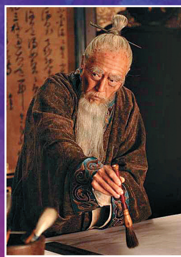
◀「奸相」嚴嵩，把持朝政二十年，老奸巨猾，只為嚴黨籌謀 網絡圖片

今年重播的《大》劇在原版基礎上進行了一番修復，然而在拍攝手法日趨發達的今天，這部於十年前即採取標準攝像機拍攝的電視劇，很難符合現在優劇人對高畫質的要求。但這都不影響它的經典程度，當中暗潮湧動的朝堂對峙，可謂歷久彌新，細細品來，依然驚喜不斷。該劇是導演張黎與編劇劉和平繼《雍正王朝》後的二度合作，如果說《大秦帝國之崛起》展現的是強國之道，《大》劇則展現明王朝被破壞、被掏空，甚至走向滅亡的全過程。