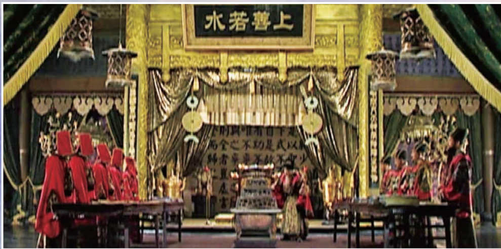
▲朝堂上諸位大臣各懷鬼胎，各為自己籌謀 網絡圖片