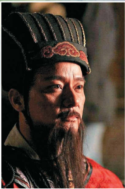
▲忠臣代表張居正，亦有私心