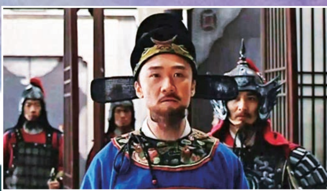
▲淳安縣令海瑞，一心為民，無黨無派