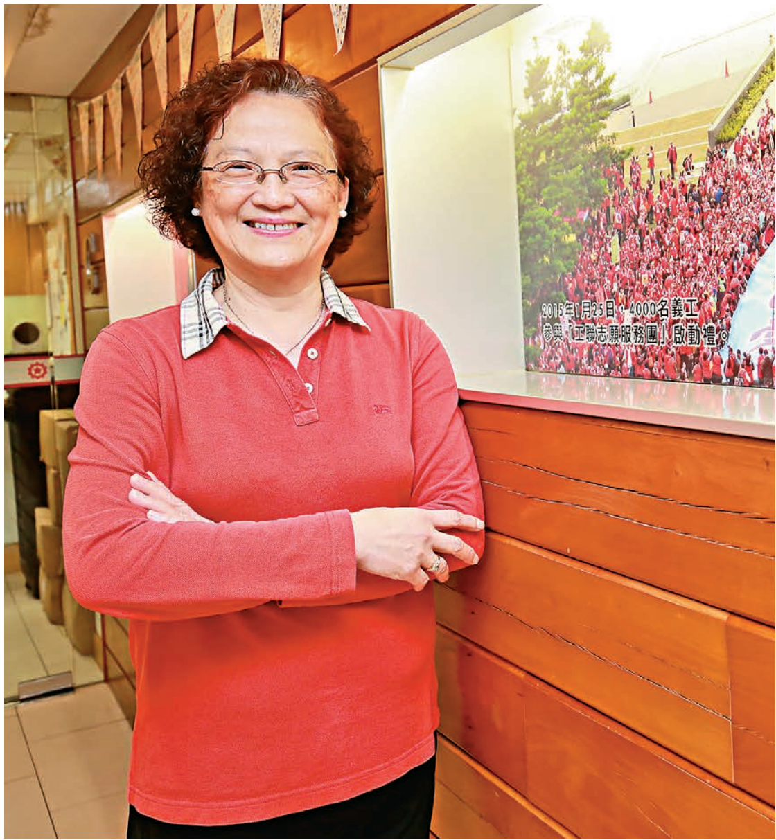
▲林淑儀認為，港人也應該着眼於國家發展策略，把握粵港澳大灣區和「一帶一路」的商機

「以工會為家，以國家為盾」，自幼與工會結緣的工聯會會長林淑儀，在近50年的工會生涯中，歷經了亞洲金融風暴、沙士疫情等多次危機，深感國家是幫助香港屢渡時艱的堅強後盾。林淑儀認為，現時港人亦可着眼國家發展策略，把握粵港澳大灣區和「一帶一路」的商機，在多個領域上各展所長。