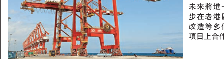
▲DMP碼頭開港是吉布提發展的里程碑，招商局與吉布提未來將進一步在老港區改造等多個項目上合作

DMP碼頭總投資額為5.8億美元，經過近兩年半的建設，該碼頭於今年2月完工，年設計散雜貨吞吐能力為708萬噸，集裝箱吞吐能力20萬標箱。吉布提地處亞丁灣西岸，面對紅海南大門曼德海峽，是國際主要航線的必經之海峽，可輻射東非、中東、紅海及印度西岸地區。DMP碼頭擁有高效的現代化設備，招商局港口冀該碼頭能發揮區域競爭優勢，打造東非航運中心。