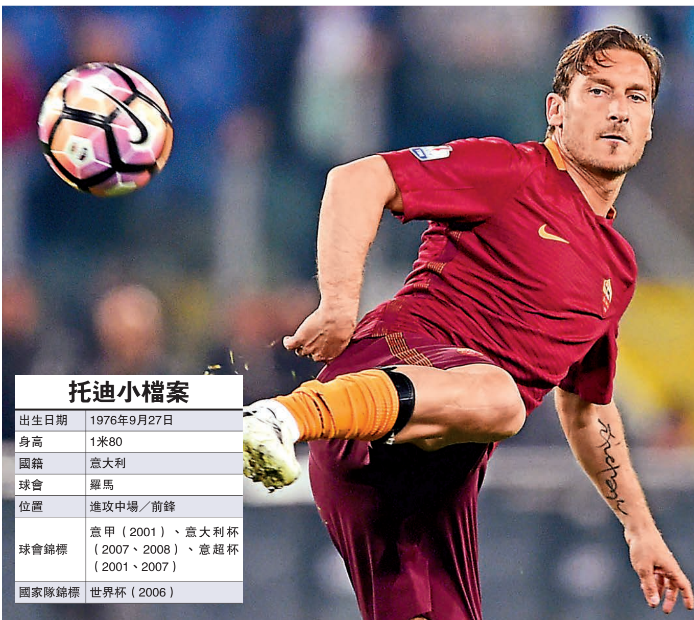
▲托迪一生只為羅馬效力