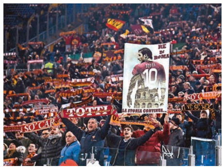
▲托迪在羅馬球迷心中，擁有崇高地位

英格蘭「萬人迷」碧咸亦透露在美職比賽時曾有機會加盟羅馬，最大吸引力正是托迪，可惜最終未能成事；祖雲達斯傳奇「金童」迪比亞路甘拜下風，讚揚托迪的表現「在另一個水平」。