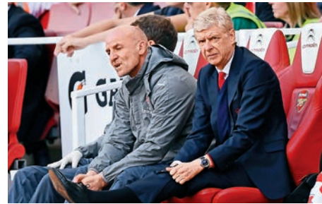
▲雲加（右）續獲阿仙奴管理層信任

上至天空、下至球場內外，本季不斷都有球迷拉起聲討雲加的橫額，對此掌帥逾20年的雲加反擊說：「受到批評，和受到作為人所不應遭遇的對待是兩碼子的事，我永遠不會忘記，亦永遠不會接受。」