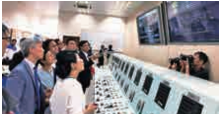
▲議員在木湖抽水站東江水水質監控站聆聽講解