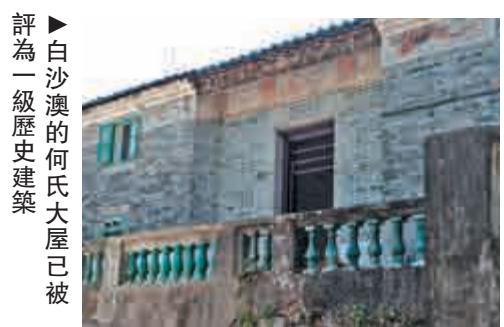
評為一級歷史建築的白沙澳的何氏大屋已被

村民如何對待自己的祖居，各有各的想法。白沙澳和白沙澳下洋屬於郊野公園的「不包括土地」，不受現有的《郊野公園條例》保障，地產商早已開始默默收地。年前有環保團體發現濕地遭人大規模破壞，其間更有挖土機駛入，原有的綠草藍天正在變色。