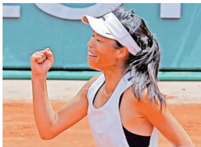
▲謝淑薇在苦戰獲勝後握拳慶祝。