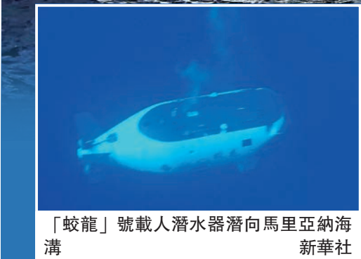
「蛟龍」號載人潛水器潛向馬里亞納海溝