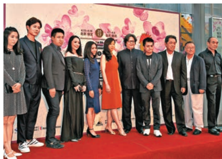
▲第九屆兩岸電影展在台北開幕

張藝謀女兒張末以及楊樹鵬、姚婷婷、王學博等大陸青年一代導演6月1日一同出席台北第九屆兩岸電影展開幕式。