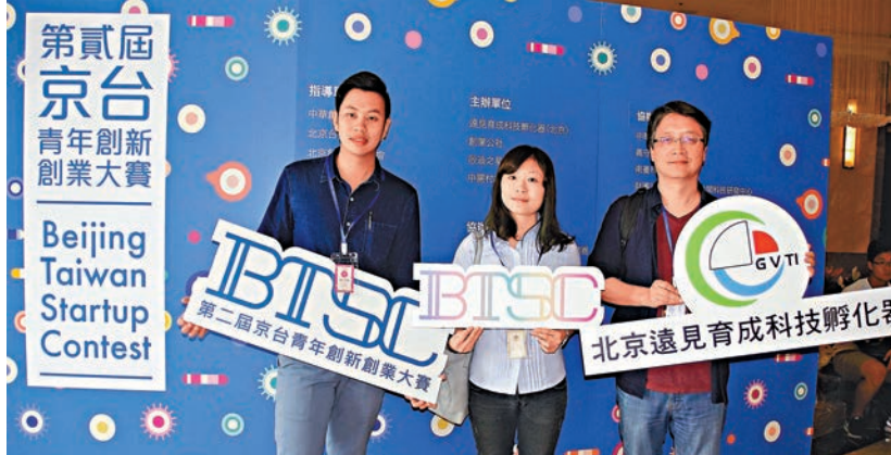
▲島內薪水低，台灣青年希望到大陸打拼。圖為京台青年創新創業大賽台灣企業組複賽一日在高雄登場

學及以下」佔11.04%次之，「高職」9.08%最低。勞動部分分析，青少年初入職場尚在學習摸索階段，專業職能較爲不足，工作期望與就業市場現況存有差距，且多非家計主要負擔者，轉換工作頻率高。