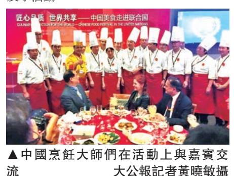
▲中國烹飪大師們在活動上與嘉賓交流

廣活動。來到紐約之前，烹飪協會代表團剛剛結束了在美國首都華盛頓特區的美食展示活動。