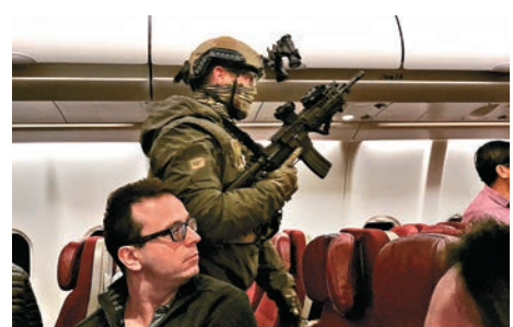
▲特警全副武裝登上事發客機