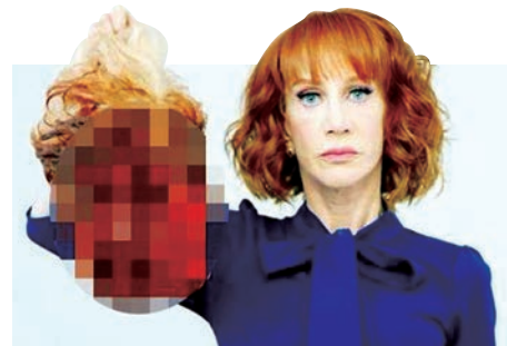
▲美國女星格里芬的惡搞照片引發抨擊 網上圖片

【大公報訊】據路透社報道：美國喜劇女星凱西·格里芬日前拍攝手提美國總統特朗普「斷頭」模型血腥照片，引起各界一面倒的抨擊聲浪。6月1日，美國有線電視新聞網(CNN)宣布終止與格里芬長達十年的合作關係。