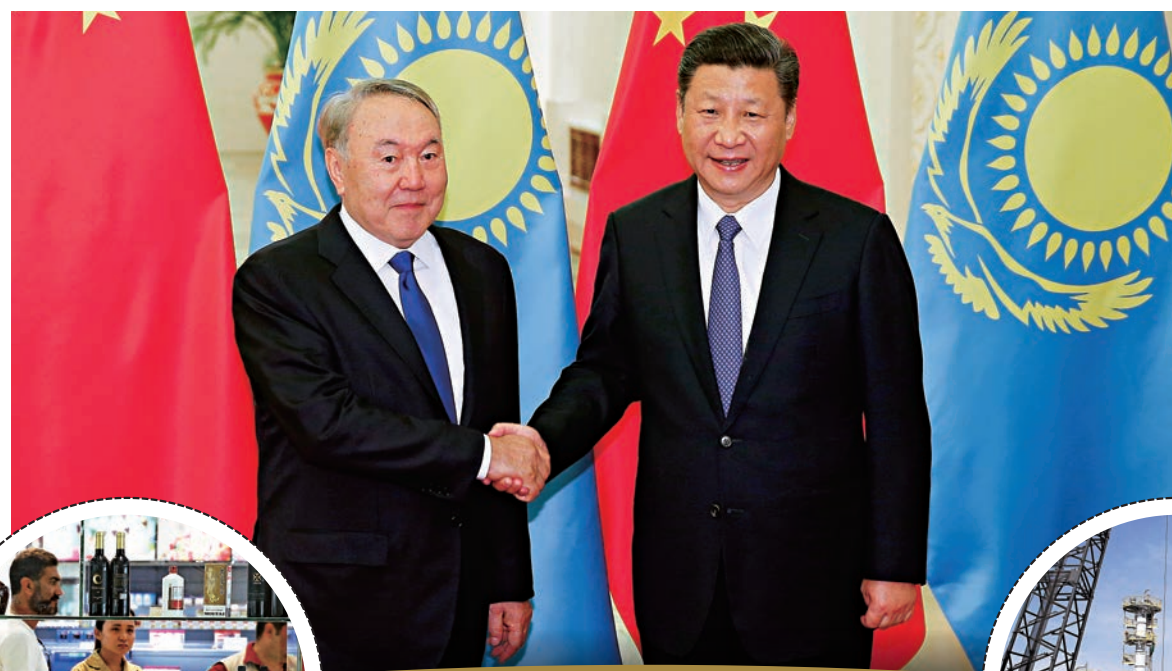
◀5月14日，中國國家主席習近平與哈薩克斯坦總統納扎爾巴耶夫在阿斯塔納舉行的上合組織成員國元首理事會第十七次會議上會見。資料圖片