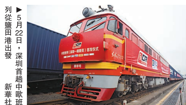
▶5月22日，深圳首趟中歐班列從鹽田港出發。新華社