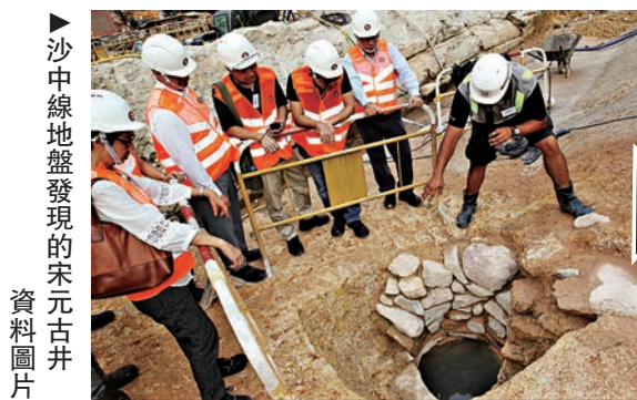
沙中線地盤發現的宋元古井