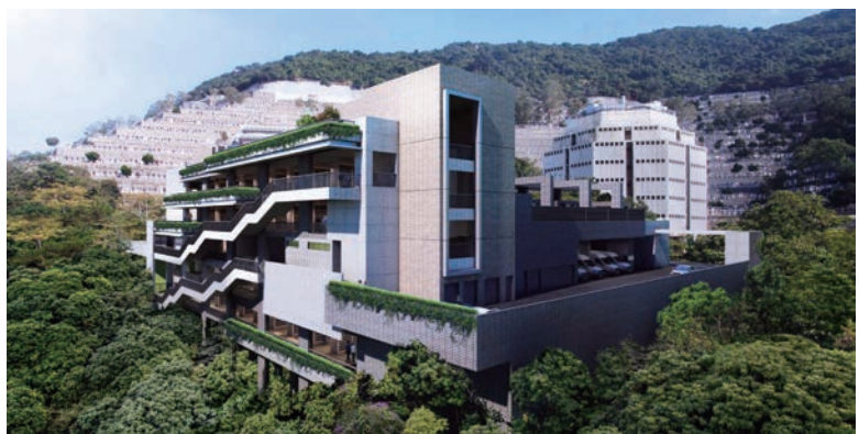
▶歌連臣角道擬建的骨灰安置所模擬圖

此次提出興建直上扶手電梯，他認為工程有難度，擔心日後電梯使用人流量大，且位於室外。若發生損壞，是否可即時維修，以及保證人流暢通。