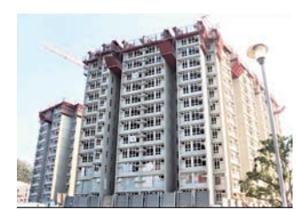
▲梅窩銀蔚苑最平單位僅需139萬元